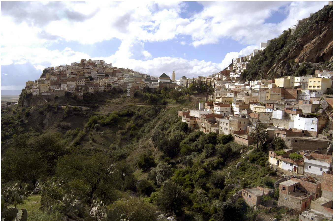
5. Moulay Idriss, kolebka Islamu w Maroku