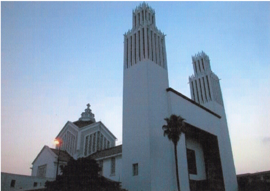
2.Katedra św. Piotra w Rabacie