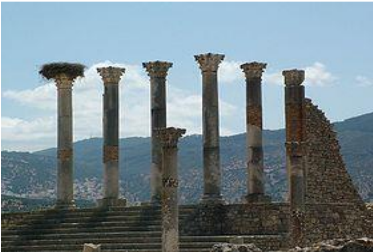
3.Ruiny Volubilis, stolicy prowincji rzymskiej Mauretanii Tingitana