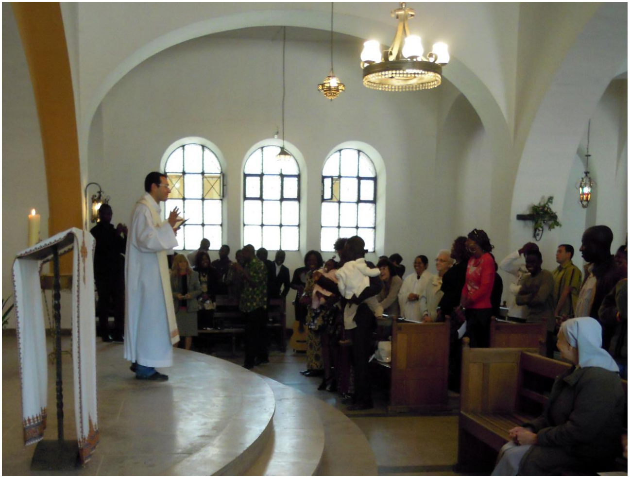
10. Msza Św. w kaplicy Kościoła Notre Dame des Oliviers w Meknesie (kwiecień, 2010)