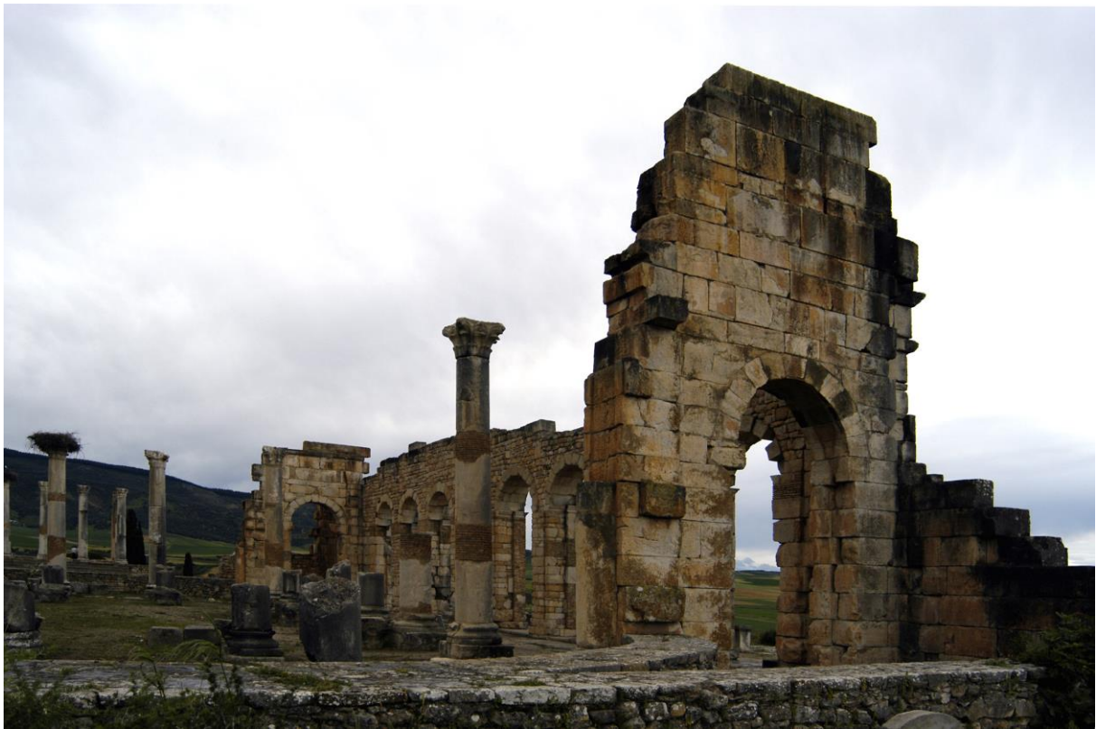
4. Ruiny Volubilis