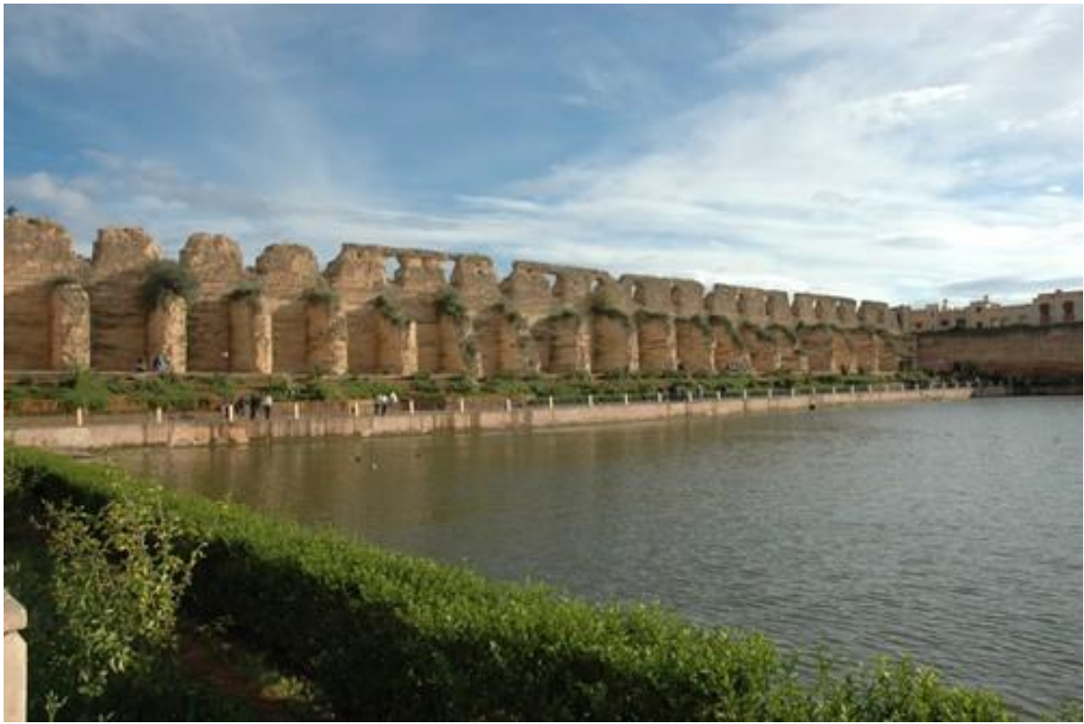
8. Aguedal, zbiornik wodny z czasów Moulay Ismaïla