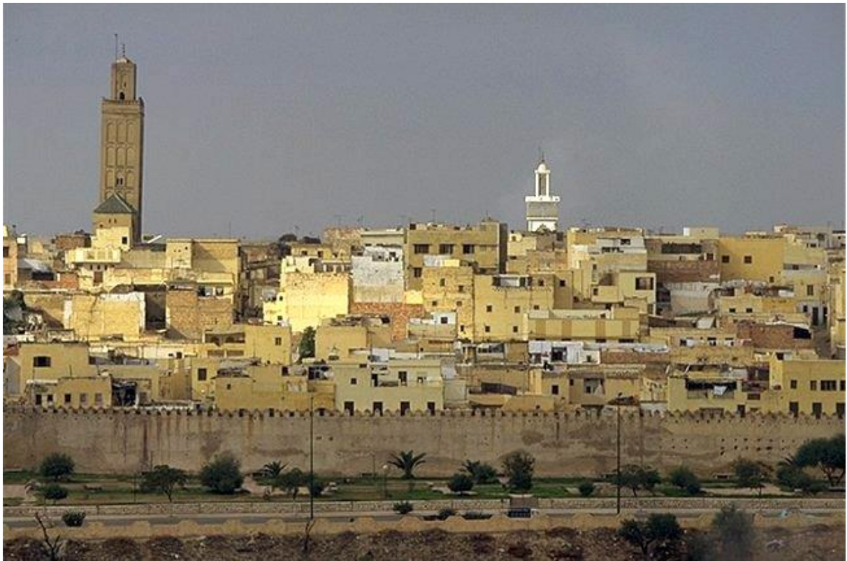
6. Meknes, stolica Moulay Ismaila