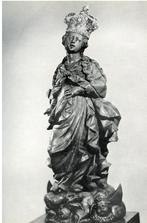
9. Matka Boska Patronka więźniów chrześcijańskich w Meknesie