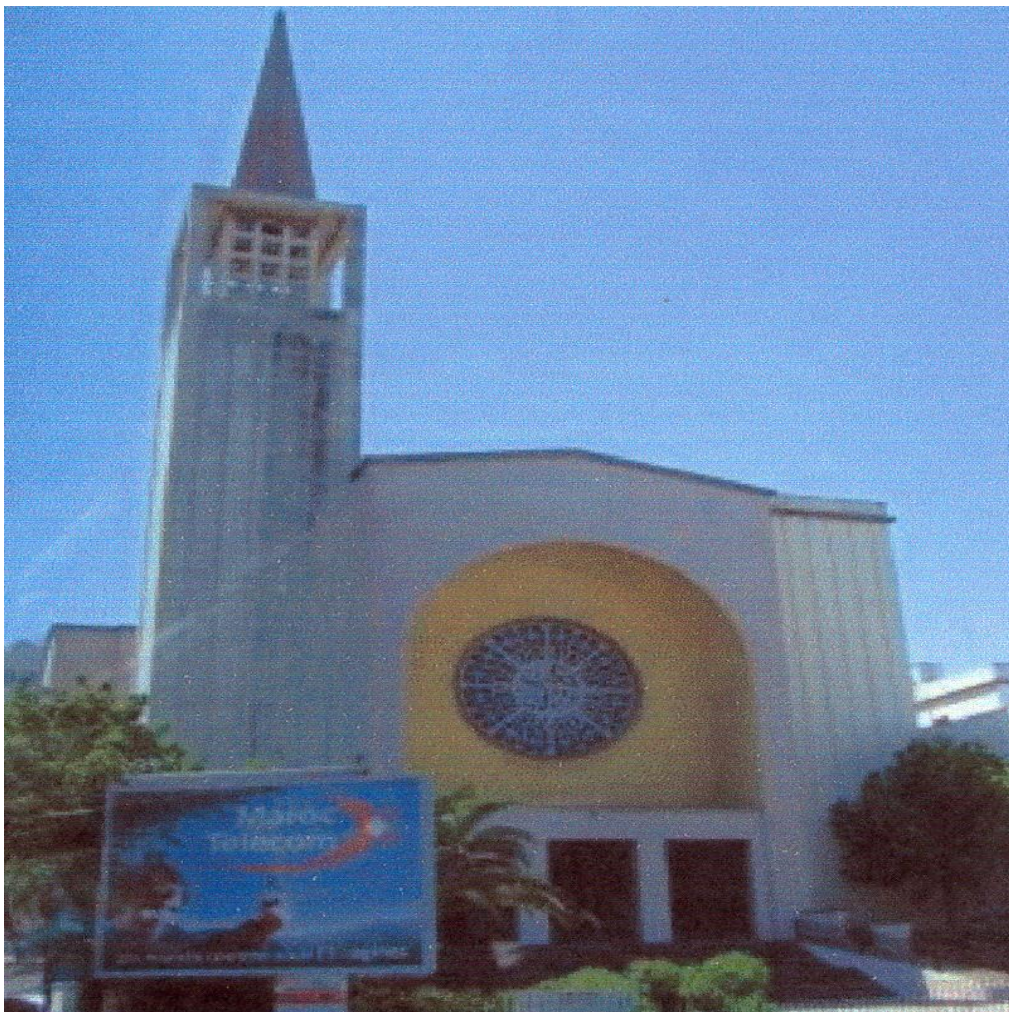
1. Katedra hiszpańska pod wezwaniem Matki Boskiej z Lourdes w Tangerze.